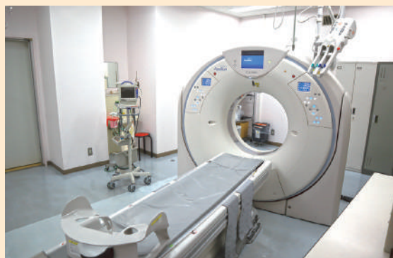
▲ CT 検査装置

地域の皆さんの安心な暮らしに貢献できるよう、診療所等、各医療機関との連携に今後も力を入れてまいります。