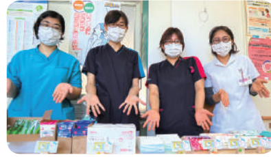
◀看護の日に合わせ、マスク等の配布も行いました