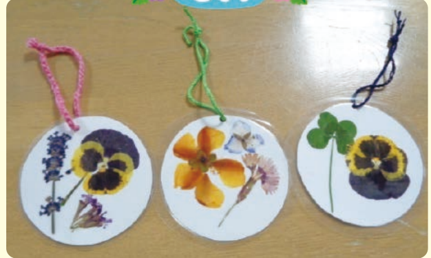
押し花で綺麗な名札が出来ました。