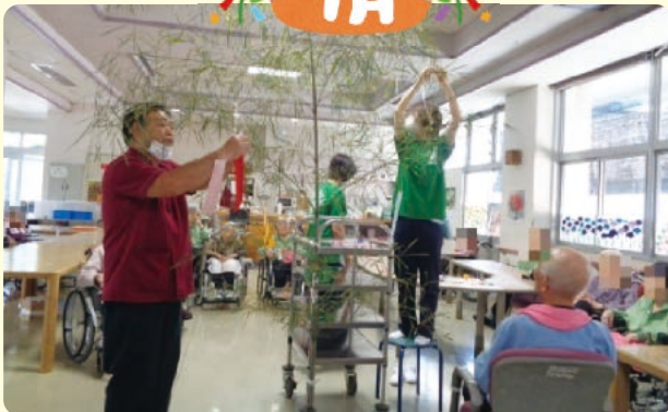
七夕祭りでは願い事を笹に飾りました。