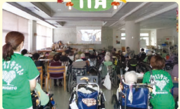
シートをスクリーンにして真さん鑑賞

ほかにも「動物ふれあい訪問」で犬・猫・うさぎに癒されたり、季節を感じるために正月飾りのおやすを作ったり、職員手作りの行事を取り入れています。