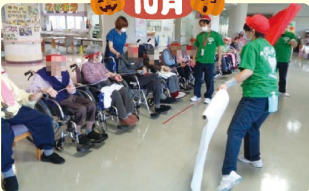
運動会では赤・白チームに分かれ対決!