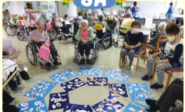
夏祭りの魚釣りゲームの様子です。