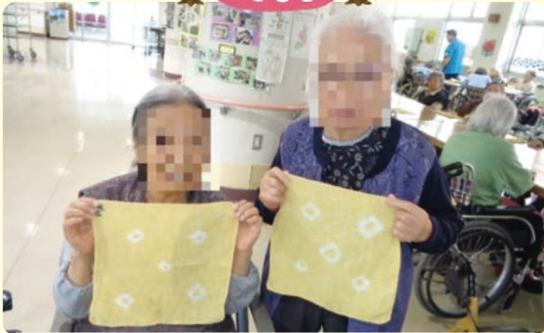
草木染めしました。良い仕上がりです!