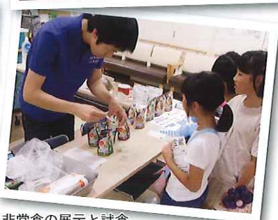
非常食の展示と試食